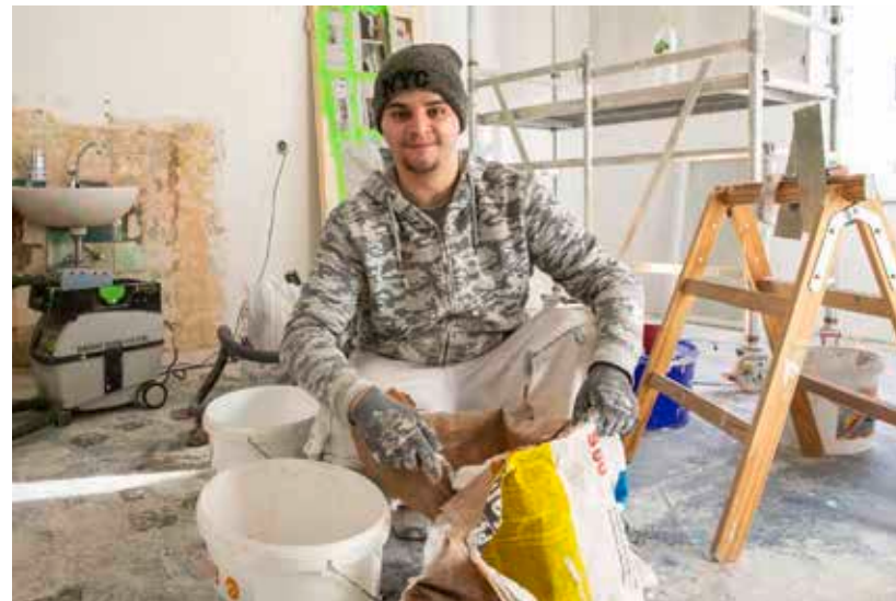
Ganz praktisch geht es bei der Diakonie Rosenheim zu. Hier renovieren Jugendliche eine Wohnung und werden zum Malerhelfer ausgebildet.