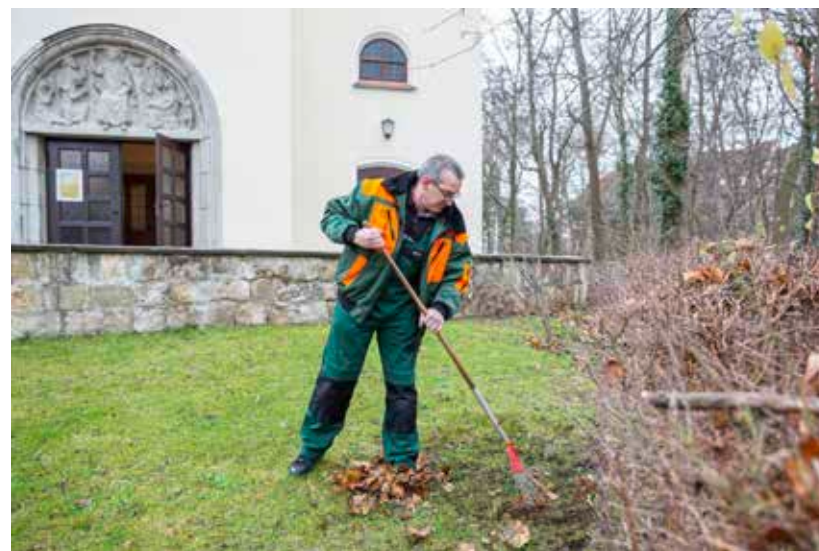
Mit Hilfe von „1+1“ konnte in einer Fürther Kirchengemeinde St. Martin ein Arbeitsplatz als Hausmeister und Mesner eingerichtet werden. Ein vormals Arbeitsloser ist „wieder dabei“.